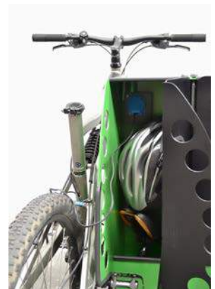
Detall allotjament bicicleta/batería endollada + protecció seient+ casc