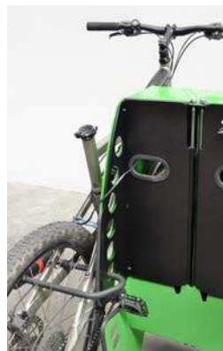
Detall bicicleta lligada i bloqueig tapa amb la protecció endoll/carregador+seient+casc