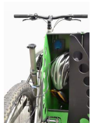
Detall allotjament bicicleta/bateria endollada + protecció seient+ casc