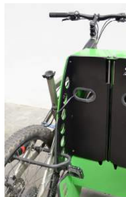
Detall bicicleta lligada i bloqueig tapa amb la protecció endoll/carregador+seient+casc